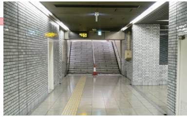
地下鉄の5番出口より出てください。