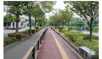
130Mほど直進してください。