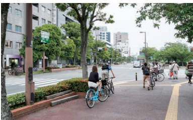
最初信号の交差点が「大手門」交差点です。