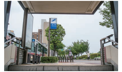
5番出口より出た際に見える風景です。