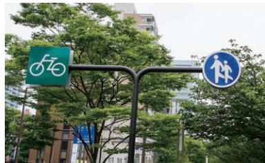
自転車用と歩行者用の道路がわかれていますのでご注意ください。