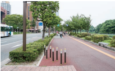
そのまま直進してください。