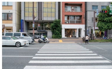
「大手門」交差点の手前側の横断歩道を渡ります。