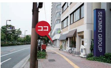
渡り終わると左手にクリニックがあります。